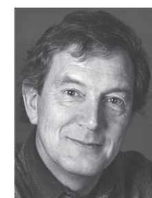
de Michel Bühler