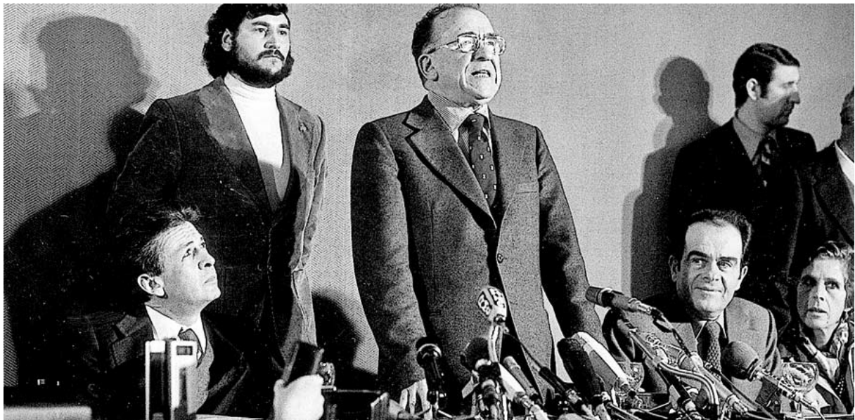
Enrico Berlinguer, Santiago Carrillo et Georges Marchais (de gauche à droite) présentent à Madrid les lignes de l'eurocommunisme quelques jours avant la légalisation du PCE.

Le Parti de la gauche européenne se fonde en 2004 sans remettre en cause la déliquescence idéologique qui a tant affaibli le communisme et la gauche en général. Tout un processus idéologique et politique a conduit les partis communistes à fonder un énième parti «de gauche» au niveau européen.