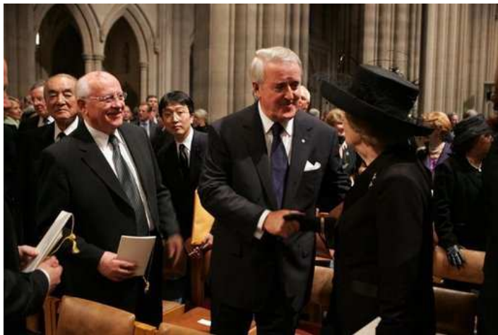
Mikhaïl Gorbatchev, Brian Mulroney et Margaret Thatcher, le 11 juin 2004 lors des funérailles de Ronald Reagan

La détente et la coexistence pacifique vont mener le bloc socialiste vers le rétablissement du capitalisme. En 1974, la Roumanie est le premier pays du bloc socialiste qui signe un accord avec la Communauté européenne, l'incluant dans le système de préférences généralisées, ce qui lui confère des subventions.