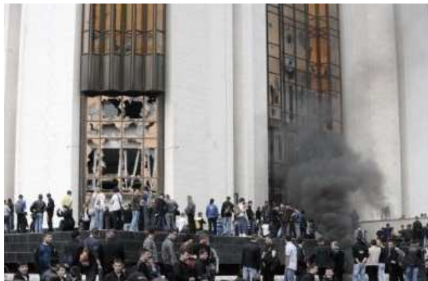
Des émeutiers ont pris d'assaut la présidence à Chisinau le 7 avril 2009

antidémocratiques et d'autre part pour renforcer la souveraineté et la volonté populaire. Alors que les peuples se méfient à raison de la construction européenne, la participation aux élections européennes par le PGE représente une stratégie qui renforce les institutions bourgeoises de l'UE capitaliste. Partant, elle décourage la lutte de classe menée par les travailleurs sur le plan local et national, puisqu'ils doivent en plus organiser la lutte contre la concentration du pouvoir de l'Europe sur le plan supranational.